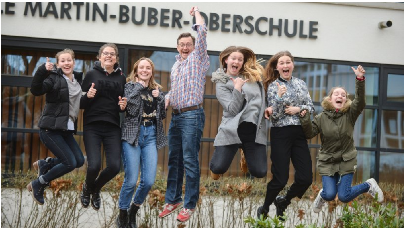
Schüler und Lehrer der Martin-Buber-Oberschule. Die Schule gehört zu den beliebtesten in Berlin